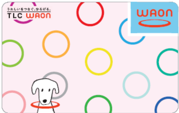
< TLC WAON (リング) >