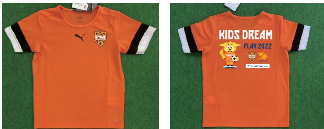
▲特製キッズTシャツ

【問合せ先】 (株)エスパルス 『TOKAI グループ presents KIDS DREAM PLAN 2022』 係 TEL : 050-9002-5917 (平日 10:00~18:00) FAX : 054-336-7755